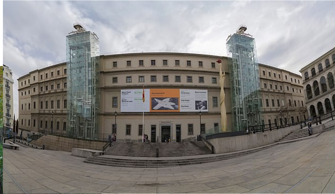
Musée de la Reina Sofía.