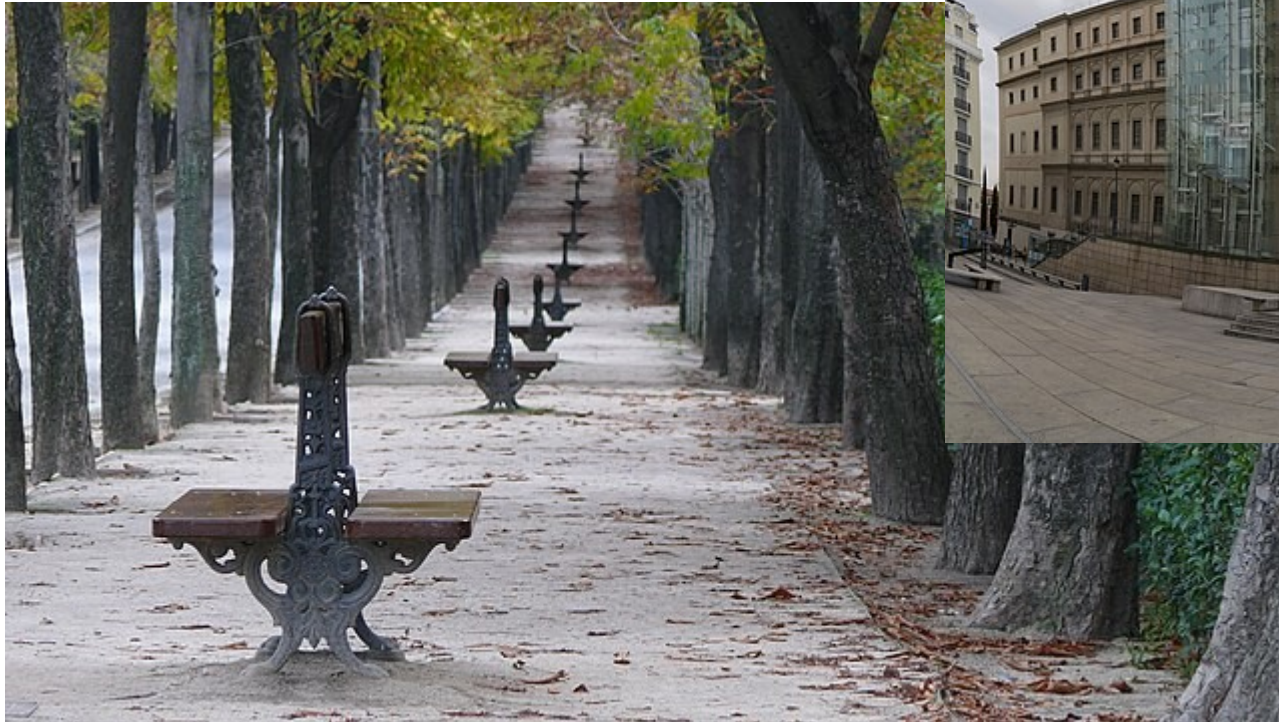
El Buen Retiro